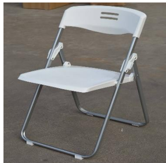
樣式（圖片僅供參考） 尺寸：150 cm（長）×60 cm（寬）×75cm（高）